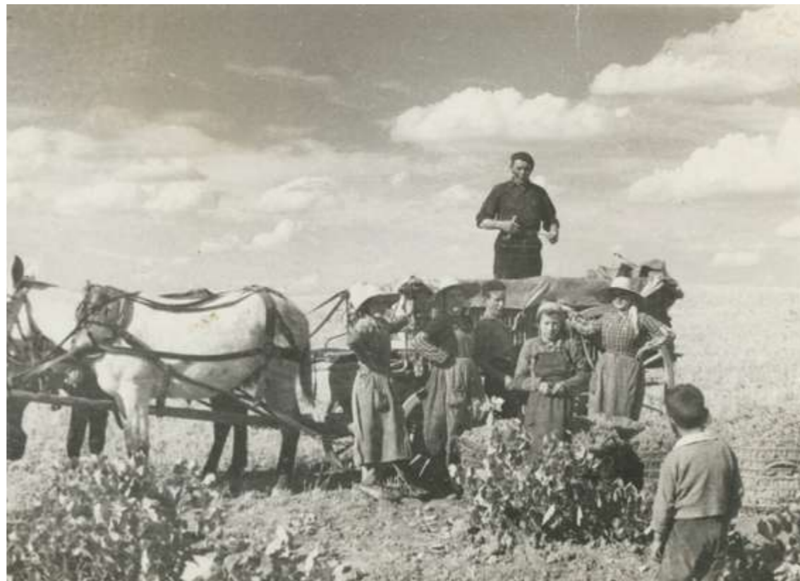
→ Vendimia durante el siglo XX

A mediados del siglo XIX, Campo de Criptana era un pueblo eminentemente agrícola donde destacaba con mucho el cultivo del cereal, siendo la vid un cultivo menor y el olivar un