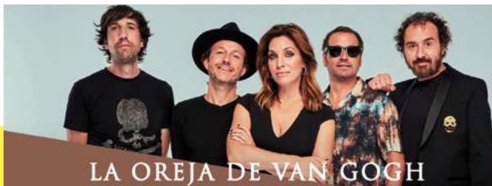
LA OREJA DE VAN GOGH

- Auditorio Municipal. Entradas a la venta en www.globalentradas.com o en el Museo El Pósito (12€ anticipada / 15€ en taquilla)