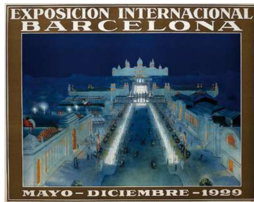
→ Cartel de la exposición Internacional de Barcelona

evolucionando la elaboración del vino en nuestro pueblo y la capacidad de sus cooperativas a pesar de la enfermedad de la vid.