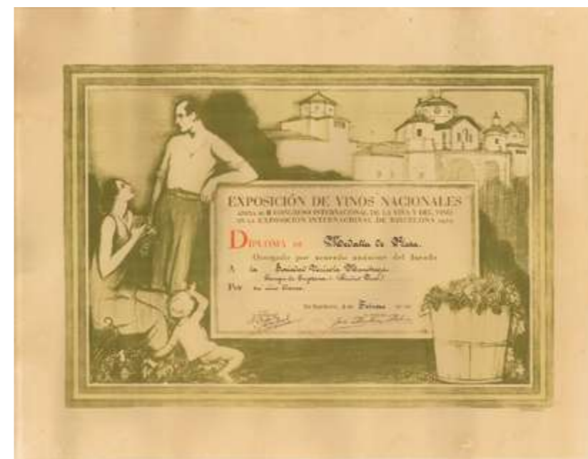
→ Diploma medalla de plata en la exposición

que su principal riqueza a desaparecido, creando una situación tan difícil a sus habitantes, que si el poder público y el mismo Ayuntamiento, no acude con urgentes remedios, aquellos o por lo menos la mayoría, tendrán que forzosamente que abandonar el campo, con todas sus lamentables consecuencias."