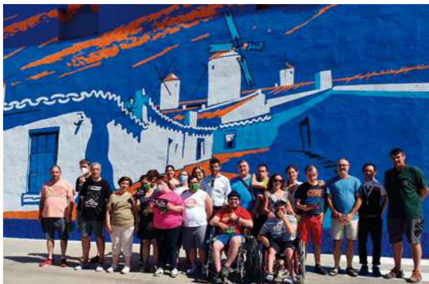
→ Mural del proyecto Cooperarte (2022)

en sesión extraordinaria no elaborar vino en ese año. En los años anteriores la cantidad de uva entregada en la cooperativa había ido decreciendo, aunque no sabemos si por cuestión de malas cosechas o por el hecho de que los agricultores decidiesen entregar su uva en las otras bodegas que en el pueblo existían.