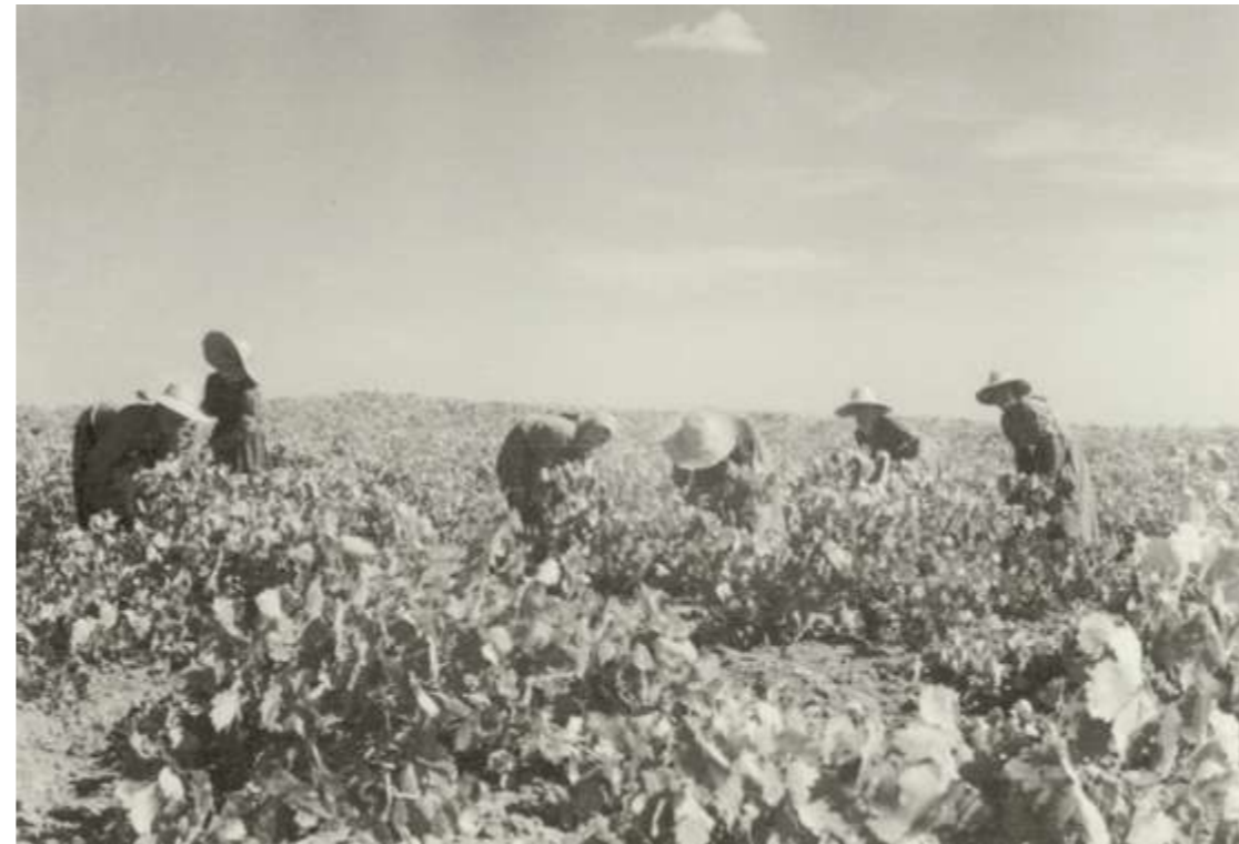
→ Vendimia durante el siglo XX

La Ley de 1906 tuvo una gran importancia, puesto que dotaba de normalidad y legalidad a todas las cooperativas agrícolas que estaban surgiendo y que, como La Manchega , no disponían de un marco legal claro en el que actuar. El Estado facilitaba de forma gratuita y preferente a los sindicatos agrícolas el uso de ejemplares selectos, semillas, máquinas y herramientas para el fomento de la agricultura. Por ello, estos sindicatos y cooperativas estaban enfocados principalmente a conseguir crédito y a la adquisición de maquinaria, herramientas, infraestructuras... todo aquello que era difícil de conseguir para un pequeño propietario aislado. Las cooperativas vinícolas de Criptana ofrecían, gracias a la unión de fuerzas, lo más di-